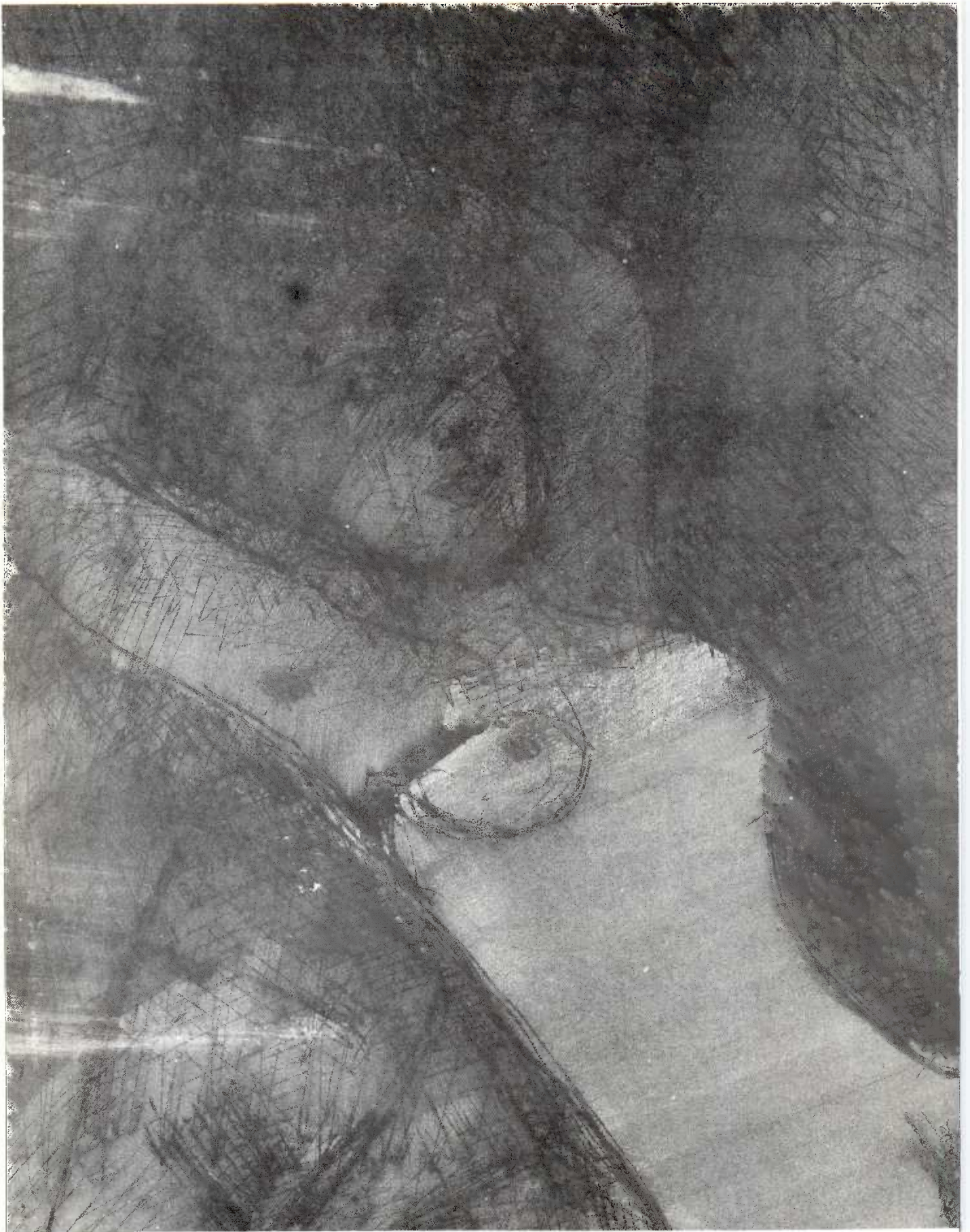
"Aquel profundo armario" Lápiz