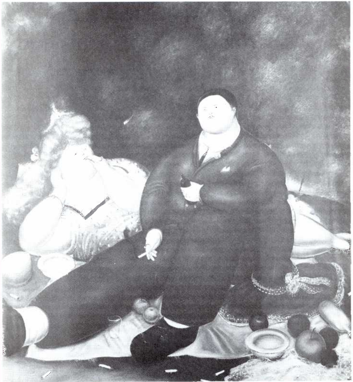
Fernando Botero: Picnic. Oleo sobre tela. 1969