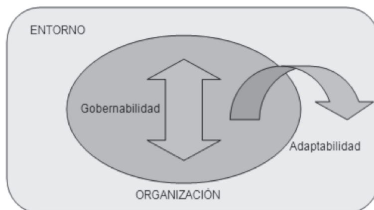
Figura 1. Viabilidad de las organizaciones