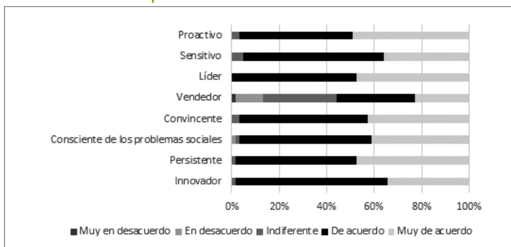
Figura 2. Características del emprendedor social