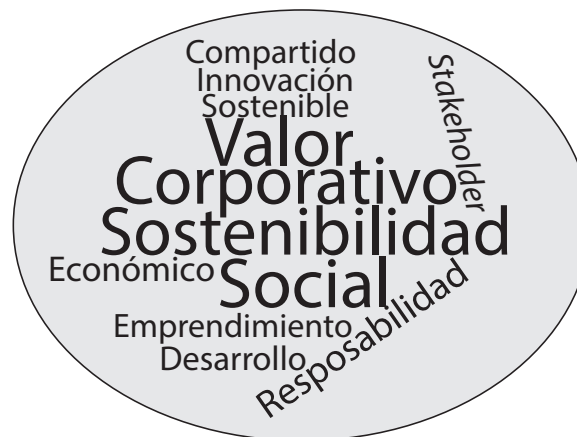
Figura 1. Palabras clave vinculadas en la búsqueda de creación de valor compartido

Fuente. Elaboración propia a partir de la consulta en Scopus y Web of Science , 2018.