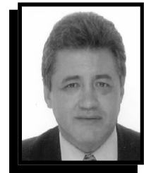
Por Edgar Enrique Zapata Guerrero

This diagnostic analysis has had fundamentals such as strategic orientation, knowledge management, logistic and production management, human resource, marketing and exportations, environmental management, communication and information management and financial management.