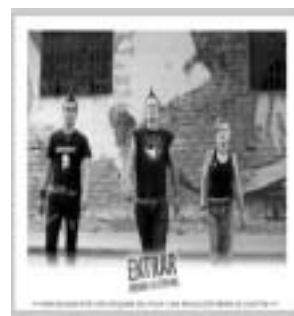
Banda: Punk Hardcore