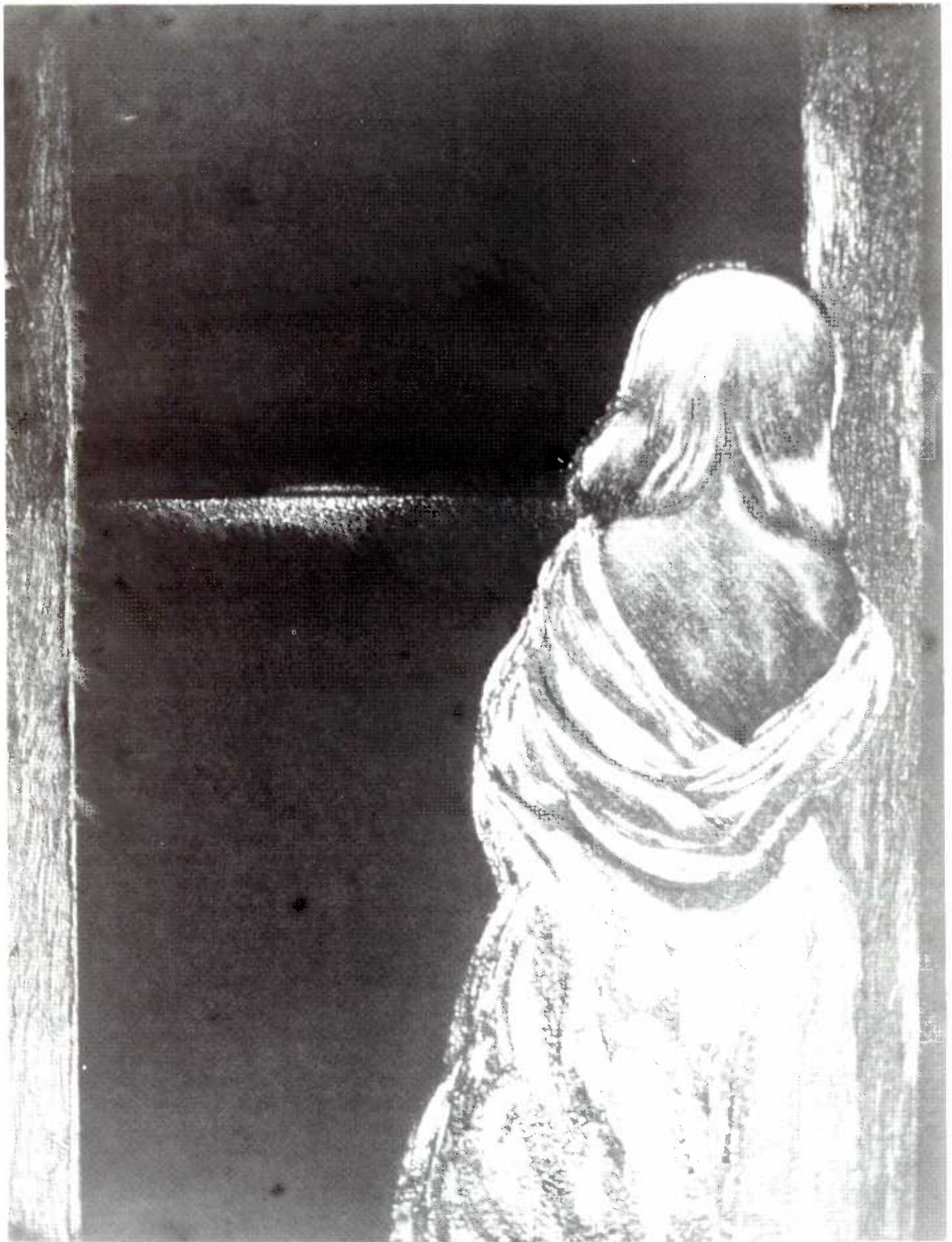
Autor: Jaime Osorio – Técnica: Aguafuerte