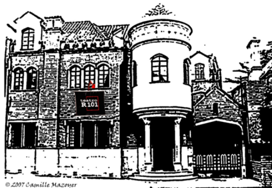
Figura 1. Fachada Teatro R-101