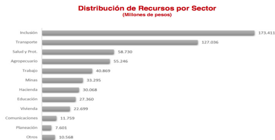
Figura 3. Distribución de recursos por sector.