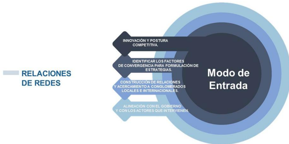
Figura 4. Perspectiva de internacionalización para pyme

estudiadas, las relaciones comerciales tuvieron mayor influencia en la selección del mercado mientras que las relaciones sociales tuvieron impacto en la expansión (véase la Tabla 3).