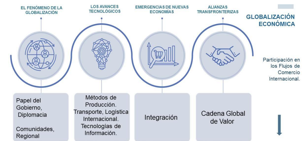
Figura 1. Globalización económica