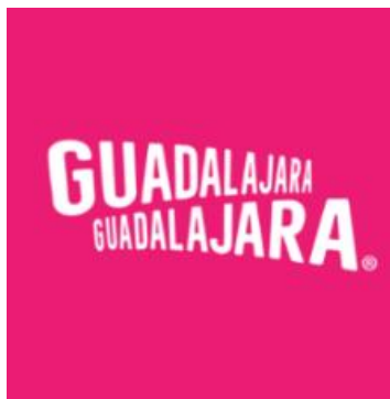
Figura 1. Logotipo de la Marca Ciudad Guadalajara Guadalajara